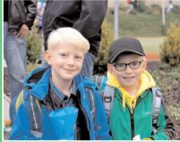
Pondělí 1. září bylo prvním školním dnem také pro žáčky 1. tříd v Základní škole ve Školní 75.