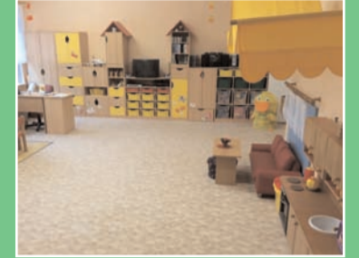
V podkroví Mateřské školy pod Svatou Horou probíhá výstavba nových ložnic pro 38 dětí.