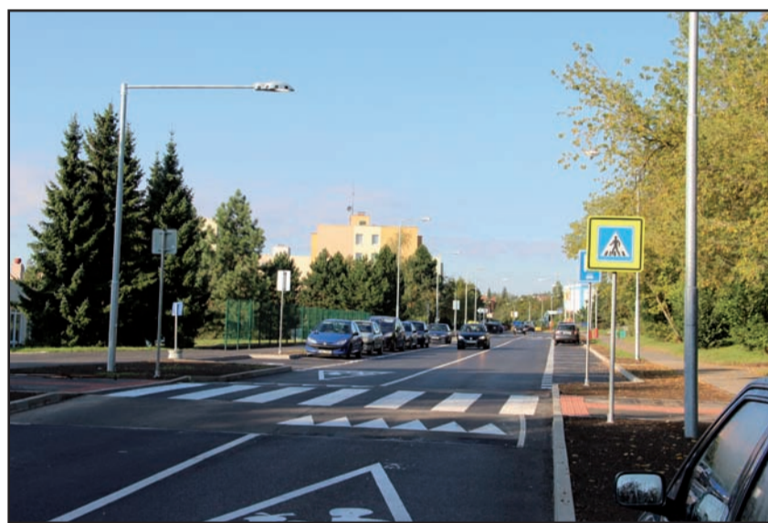
Ve Školní ulici byla vybudována nová parkovací místa, která pomohou hlavně rodičům dovážejícím své děti do základní školy.

Město Příbram je zřizovatelem několika škol a školských zařízení, konkrétně se jedná o 7 základních škol, 13 mateřských škol, dvou základních uměleckých škol a dvou samostatných školních jídelen.