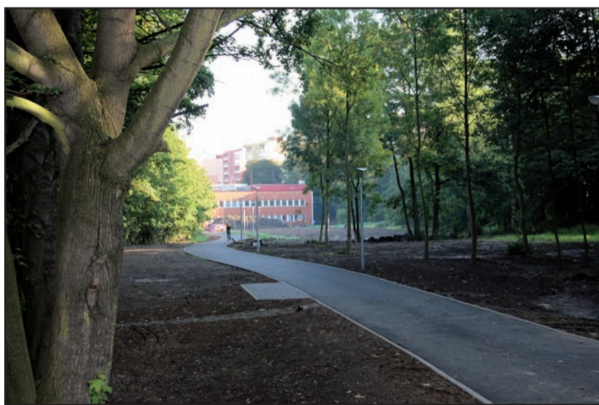
Dne 23. 9. ve 13:30 hodin u Q-klubu bude slavnostně ukončen projekt Cyklostezka Hořejší Obora – Flusárna.