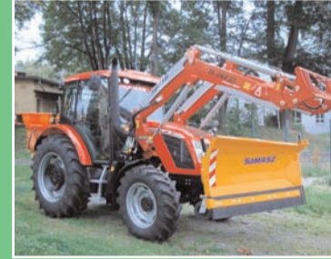
Od 13. 8. 2014 slouží Technickým službám nový traktor Zetor Proxima za 1,5 mil. Kč.